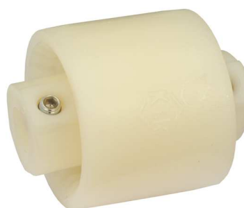
Junior M típus